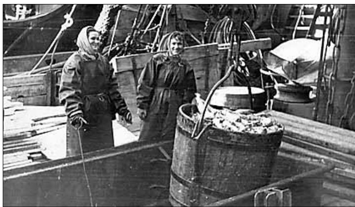
■ Доставка рыбы в порт