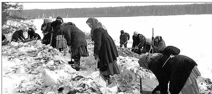
■ На оборонных работах