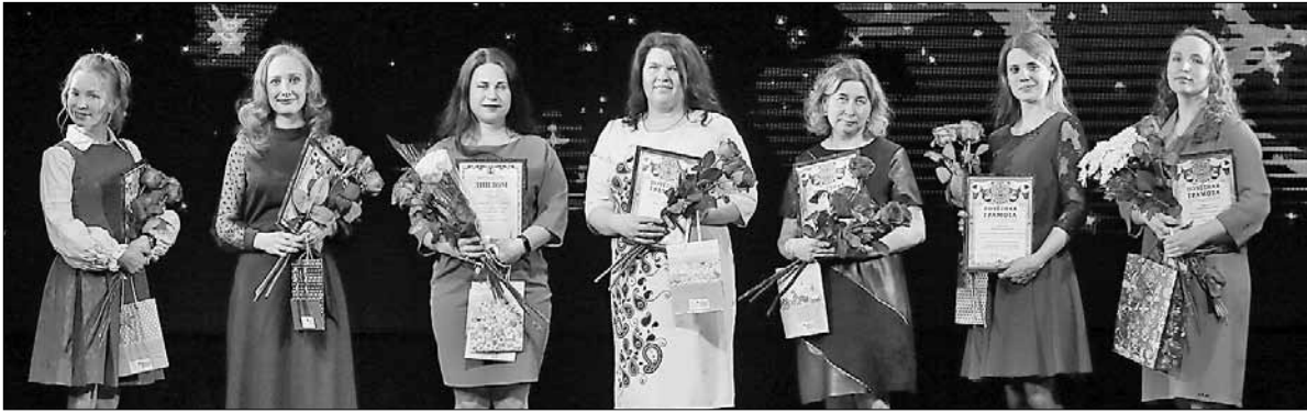
■ Участницы в номинации «Тепло материнского сердца»