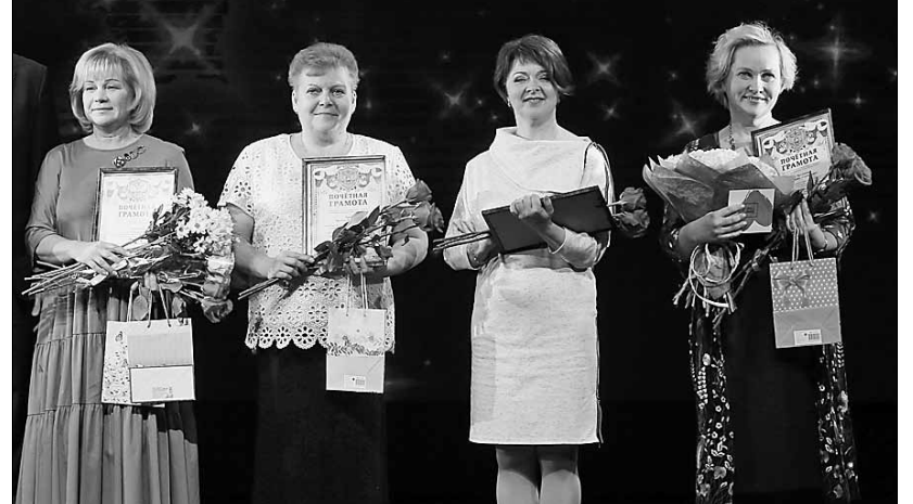
■ Участницы номинации «Хранительница северных традиций»