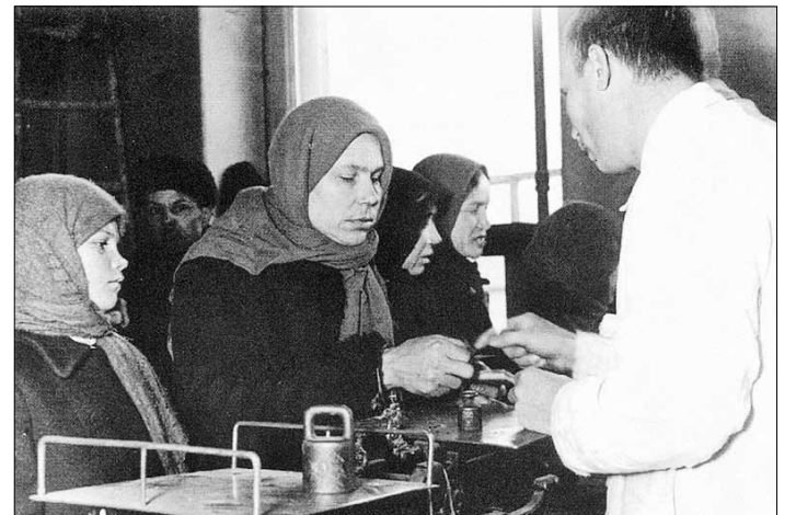
■ В магазине