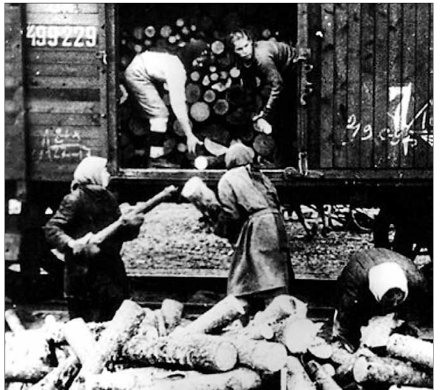
■ Заготовка дров для железной дороги

ставки мобилизуемых к станциям Северной железной дороги в порядке трудовой повинности за счет местных колхозов привлекались лошади с телегами и возчиками.