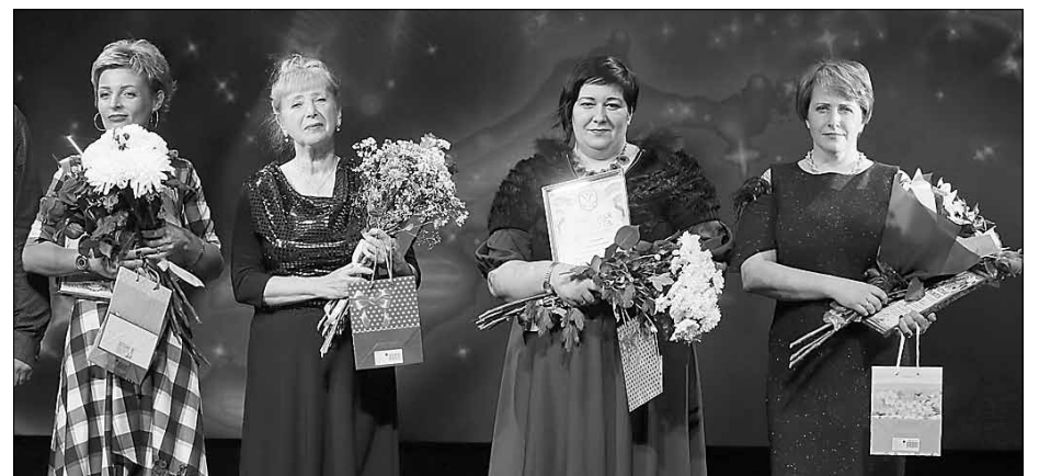
■ Участницы номинации «Женщина и общественная деятельность»

рьезное мероприятие. По образованию я учитель начальных классов, но уже давно не преподаю в школе – занимаюсь детскими центрами в Архангельске. Рада, что удалось совместить две составляющие – бизнес и работу с детьми. К нам приходят ребята с трех до 12 лет, у нас лучшая продленка, прекрасные педагоги, интересные занятия. И самые лучшие воспитанники и родители. Современные дети