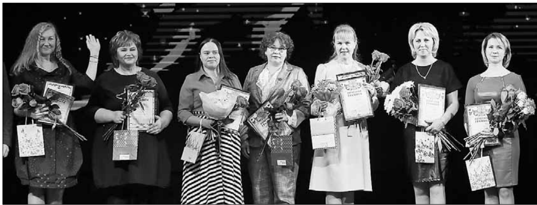
■ Участницы номинации «Женщина и профессия»