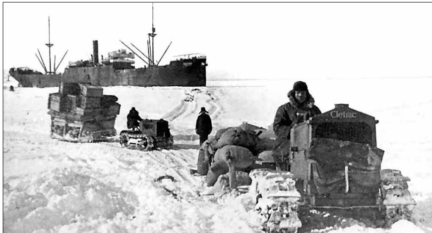
■ Ледово-дорожная служба

В соответствии с распоряжением наркома внутренних дел Л. П. Берия обком ВКП(б) принимает постановление «О мобилизации населения для проведения специальных работ». Для строительства оборонительного рубежа Вытегра – Пошехонье – Володарск было предписано мобилизовать 20 тыс. человек. Все они должны иметь при себе теплую одежду, обувь, белье, лопаты, кирки, ломы, продовольствие на 15 дней. Для до-